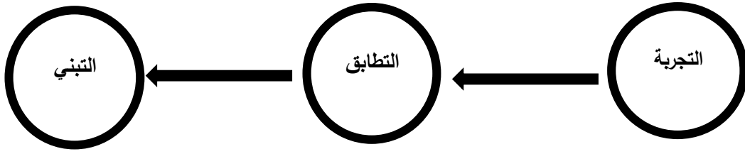
الشكل (3): جرد بواسطة الباحثة استنادًا لدراسة سلمان (2013)، وصراب (2016)